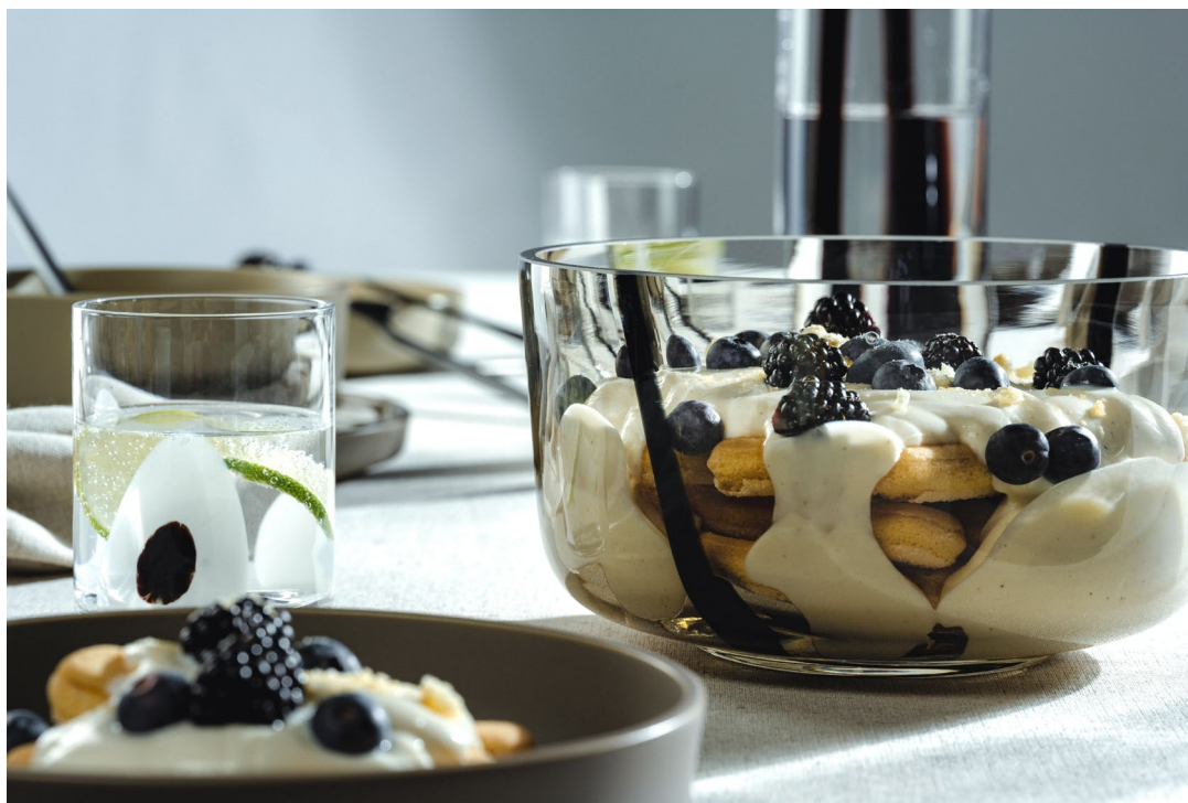
ALVEO mit ROMA