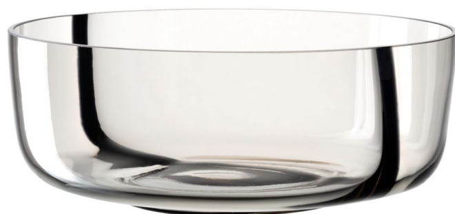
ALVEO mit ROMA